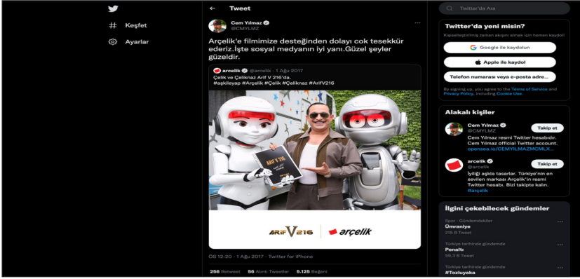
Görsel 2. Cem Yılmaz Twitter paylaşımı

Cem Yılmaz; ilgili oturumda marka ile yaptıkları iş birliğini ve iş birliklerinin sinema filmleri için önemini vurgulayan açıklamalarda bulunmuştur (Arçelik, 2017). Söyleşide karşılıklı iş birliğinin önemi ve detaylarının konuşulduğu, film ile ilgili bir ön tanıtımın yapıldığı görülmektedir. Yine Arçelik sponsorluğunda Arif V 16 filmi için çekilen reklam filminde de Çelik, Arif (Cem Yılmaz) ve robot 216 (Ozan Güven) yer almıştır ve filme dair merak uyandıracak detaylar paylaşılmıştır. Film vizyona girmeden yapılan faaliyetlerle karşılıklı bir reklam tanıtım sürecinin başladığı, Cem Yılmaz'ın kendi sosyal medya hesaplarından da markaya ait tanıtım faaliyetlerinde bulunduğu görülmektedir (bkz. Görsel II).