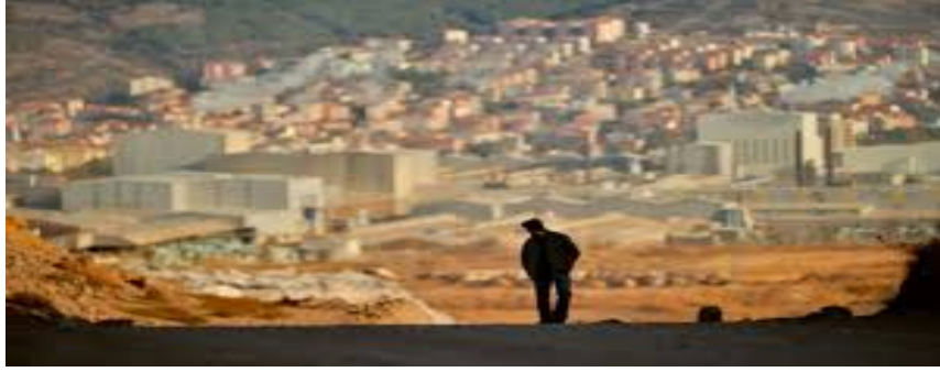
Görsel 2: Ahlat Ağacı/ Taşraya karşı olumsuz bakış