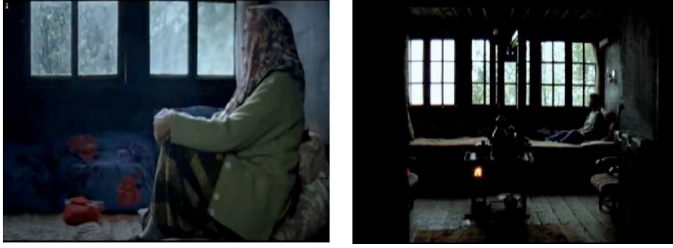
Görsel 1: Sonbahar/ Taşraya Hapsolmuşluk

Yusuf eve geldiğinde annesini, divanın üstünde dışarıyı seyredirken bulur. Bu bir anlamda karakterin annesinin de taşraya hapsolmuşlüğü göstermektedir. Annesinin içerisinde yer aldığı dağ, taş, ev kendi sınırlarını çizmekte ve başka türlü bir cezaevinin içerisinde yer aldığını göstermektedir. Yusuf'un da durumu bundan farklı değildir. Karakterin odasının penceresindeki parmaklıklardan dışarıyı seyredişi onun sınırlılıklarını belirlemektedir. Yusuf'un odasında uyuyamayışı ve uyumak için dışarıya çıkışı da bir anlamda uzun yıllar kapalı bir yerde kalmasının travmatik boyutlarını göstermektedir. Sevcan Sönmez, “Travmatik anılar, sıradan anılara ya da geçmişe ait başka üzücü olayların anılarına benzemez, ağırdır, yüzleşilmesi zordur, bilinçaltına itilmiş ve bastırılmıştır” (2015: 26) demektedir. Yusuf'un devamlı kendini cezaevindeymiş gibi hissetmesi, yaşadığı olayların ağırlığından kaynaklanmakta ve bundan dolayı karakter kapalı alanlarda kalmak konusunda zorluk çekmektedir.