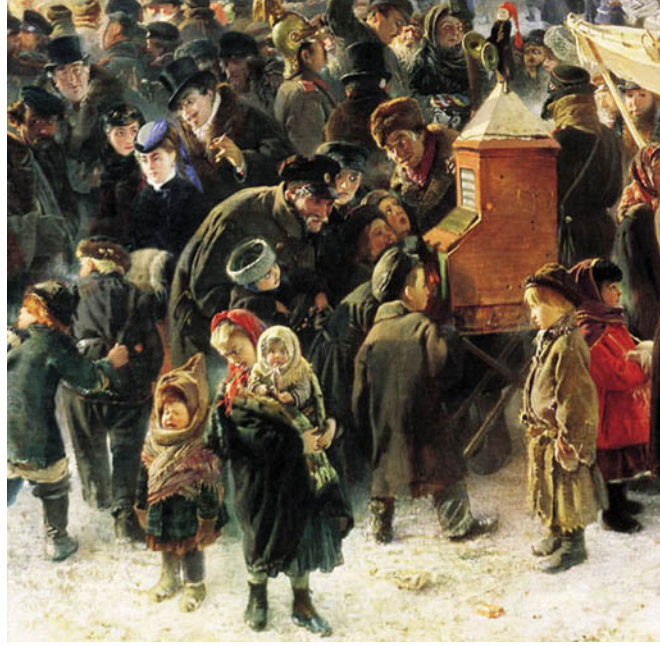
Resim 1. Fuarda Sözel ve Görsel Unsurlar Eşliğinde Reklam Gösterimi