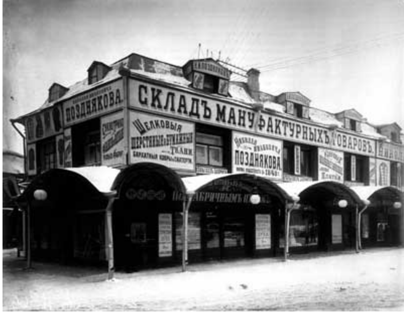
Resim 3. St. Petersburg'da Apraksin Sarayı Binası ( https://prclub.spb.ru/2018/07/31/history/ , E.T: 20.08.2021)