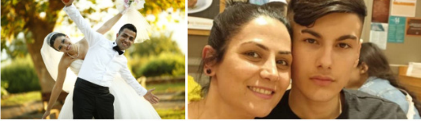
Şekil 1. Kocasından öldürülen eşin evlilik fotoğrafı ve baba tarafından öldürülen anne-oğulun fotoğrafı

Haberlerin sunum şekli ve tarzıyla ilgili olan retorik kapsamında haberlerin çoğunluğunda kurbanlara ait fotoğraflar kullanılırken, bazı haberlerde videolara ve görgü tanıklarından alıntılara yer verilmiştir. Cumhuriyet gazetesinde 3 haberde kurbanı, 3 haberde faile ve 2 haberde ise her ikisinin fotoğraflarına yer verilirken, diğer haberlerde olayın meydana geldiği mekânın görüntüleri sunulmuştur. Sabah gazetesinde 8 haberde kurbanı, 4 haberde faile, 4 haberde olay yeri fotoğraflarına, 4 haberde ise olayla ilgili videolara yer verilmiştir. Bazı haberlerde çiftlerin ve aile üyelerinin mutluluk pozlarını içeren birden fazla fotoğraf kullanılırken (Şekil 1), birkaç haberde kadınların fotoğrafları aynı haber içerisinde sıkça sunulmuş, failerin fotoğraflarına yer verilmemiştir. Diğer yandan, Rus uyruklu bir kadının öldürüldüğü cinayette çok fazla fotoğrafının kullanılması, ilgi çekici bir bulgu olarak karşımıza çıkmaktadır. Bu haberlerde cinayete ilgisi olmayan fotoğrafların kullanımını, olayları bağlamından koparmaktadır.